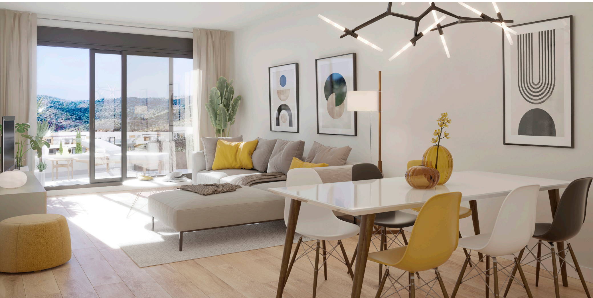
Interior de la vivienda. Acabados