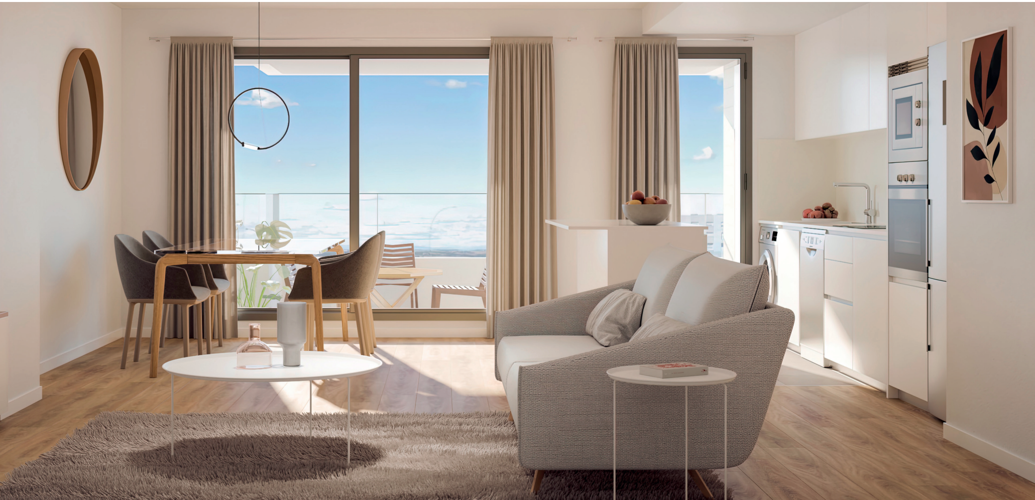
Interior de la vivienda. Acabados