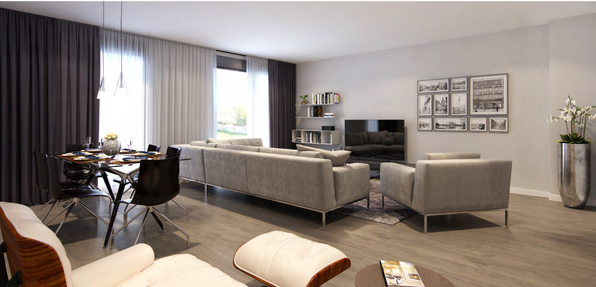
Interior de la vivienda. Acabados