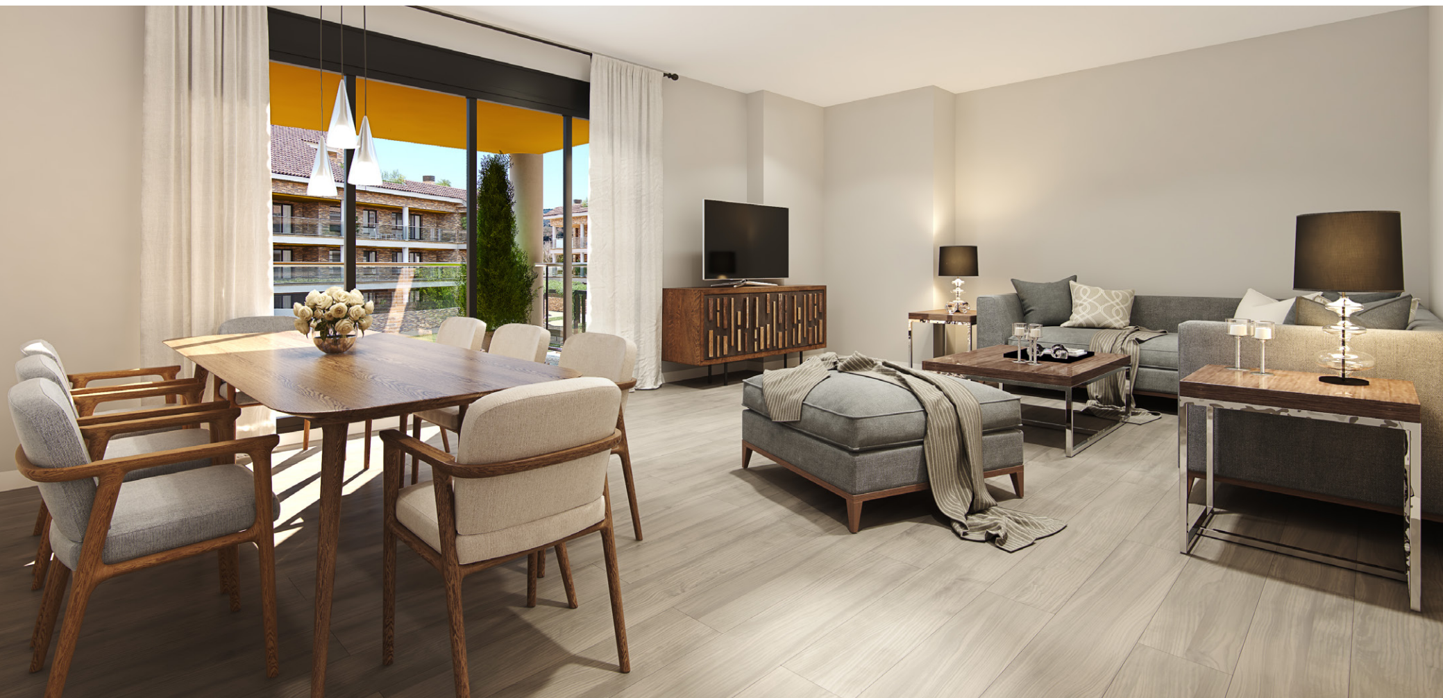
Interior de la vivienda. Acabados