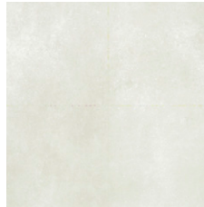
ARGENTA Porcelánico antideslizante 60x60 cm.