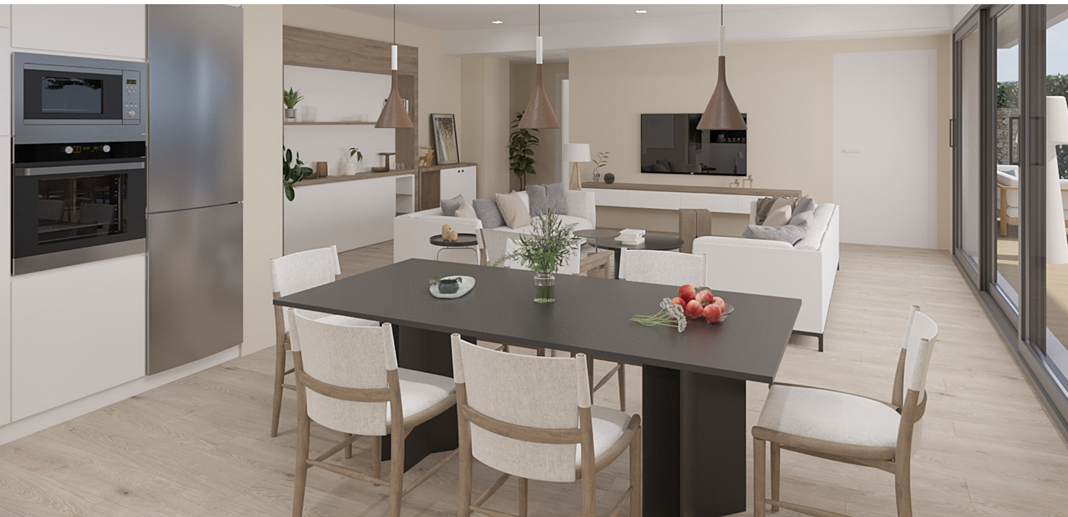
Interior de la vivienda. Acabados