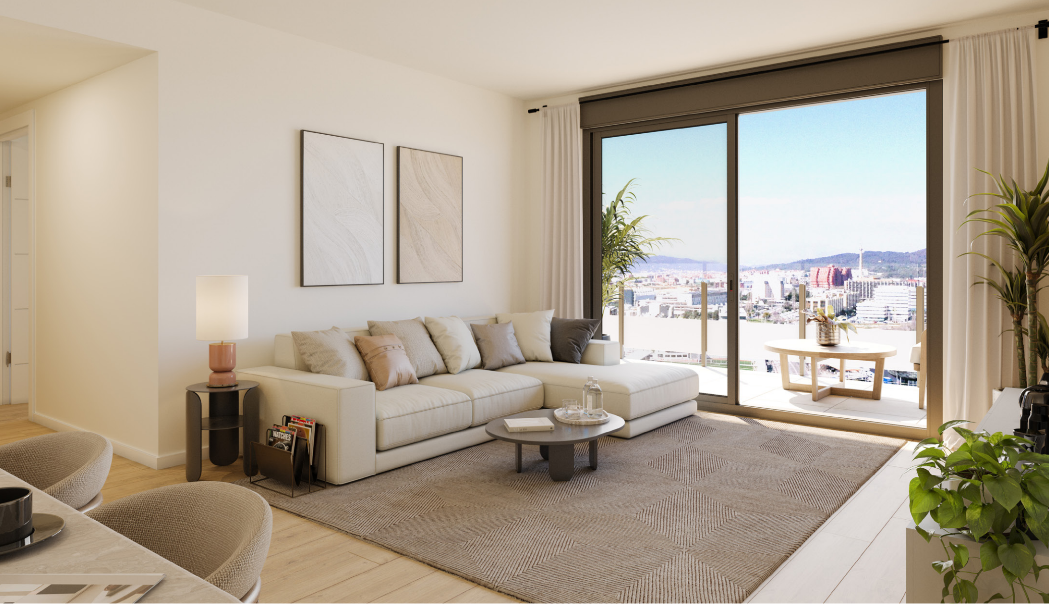
Interior de la vivienda. Acabados