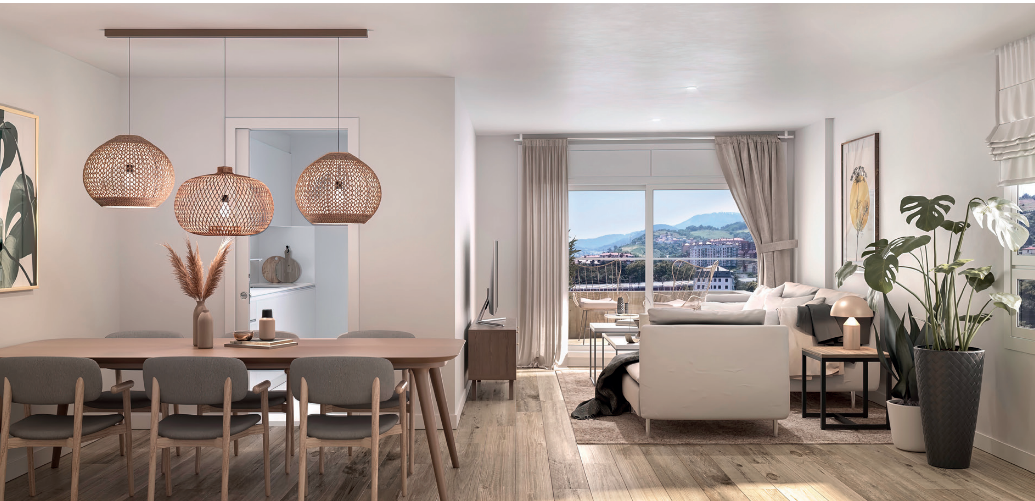
Interior de la vivienda. Acabados