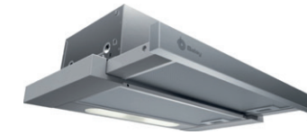
04. CAMPANA EXTRACTORA Campana telescópica. Color Gris metalizado. BALAY. REF: 3BT263MX