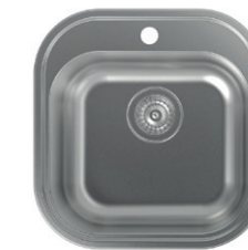
05. FREGADERO. Fregadero de acero inoxidable CATA. REF: 02612101