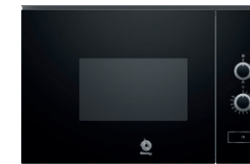
02. MICROONDAS Microondas integrable. Cristal negro. BALAY. REF: 3CP5002N2