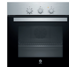
03. HORNO Horno de acero inoxidable. BALAY. REF: 3HB2010X0