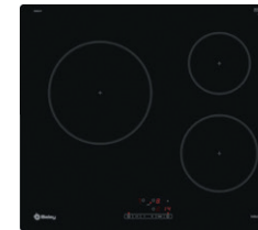
01. PLACA DE INDUCCIÓN. Placa de inducción. Color negro. BALAY. REF: 3EB864FR