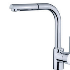
06. GRIFERÍA DE COCINA Grifo de cocina monomando con caño alto extraíble. TEKA. REF: 239381200